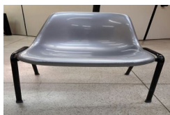
IMG-20170704-WA0006.jpg 98 KB

CMBH - Câmara Municipal de Belo Horizonte SECAPL - Seção de Apoio a Licitações Av: dos Andradas, 3.100 - Santa Efigênia - Belo Horizonte/MG - Cep: 30.260-900 Telefone: (31) 3555-1249 Fax: (31) 3555-1464