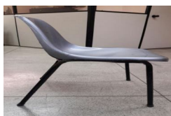
IMG-20170704-WA0008.jpg 98 KB