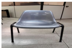
IMG-20170704-WA0007.jpg 74 KB