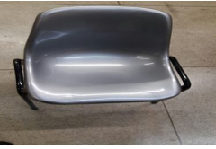
IMG-20170704-WA0009.jpg 63 KB