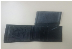
01 (3).jpeg 39 KB