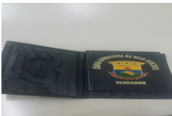
01 (2).jpeg 50 KB