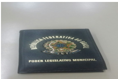
01 (1).jpeg 63 KB