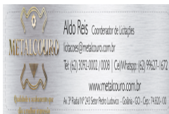
image003.png 125 KB