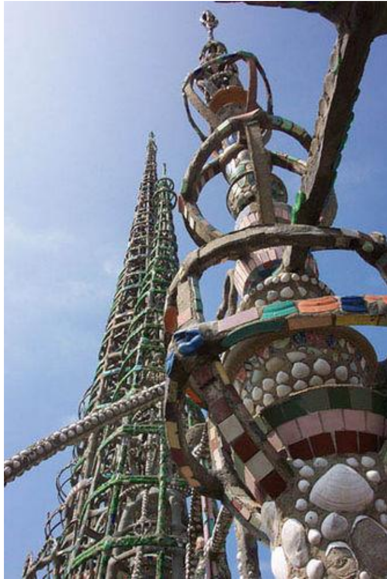
Watts Towers (Los Angeles)