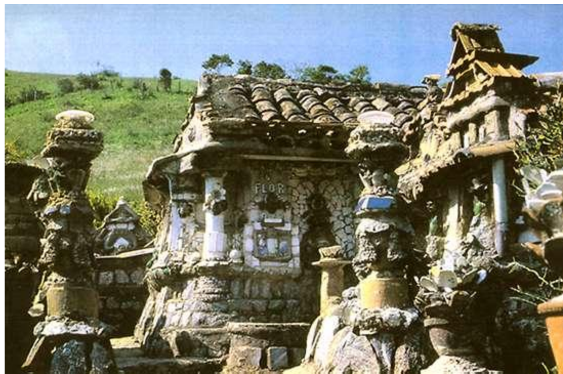
Casa da Flor - São Pedro da Aldeia, RJ